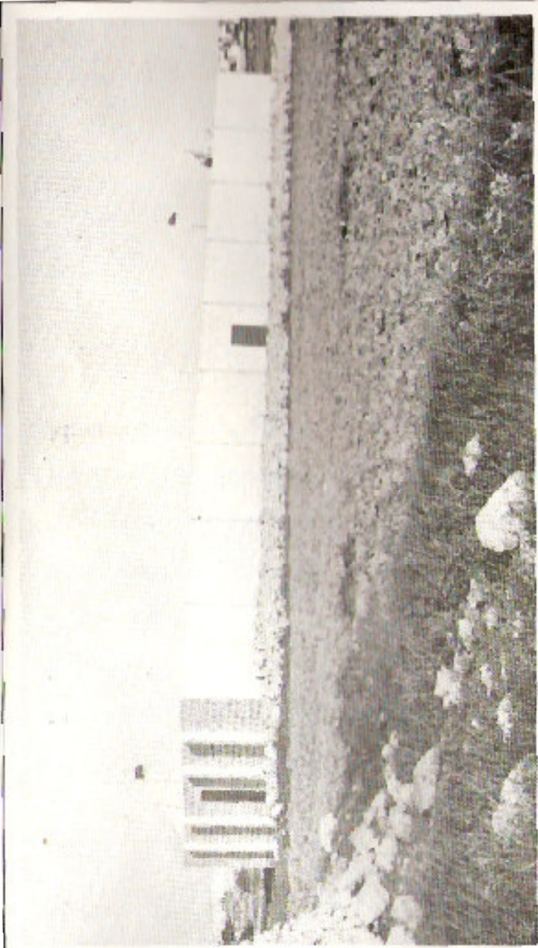
IL-POST TAN-NAR IL-GDID TAS-SIGGIEWI